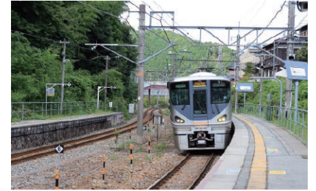
鉄道や高速道路の利用で都市圏との往来がしやすいことも丹波の魅力だ

丹波の魅力を地元の若い人にも感じてもらおうと様々な取り組みが行われています。兵庫教育委員会からひょうごスーパーハイスクールの指定を受けた柏原高校では、地域が抱える課題の解決を通して国際的に活躍できるグローバル・リーダーを育成することを目標に、里山、地域医療、防災、Uターン・Iターンなどの研究を通して、地域愛を育んでいます。