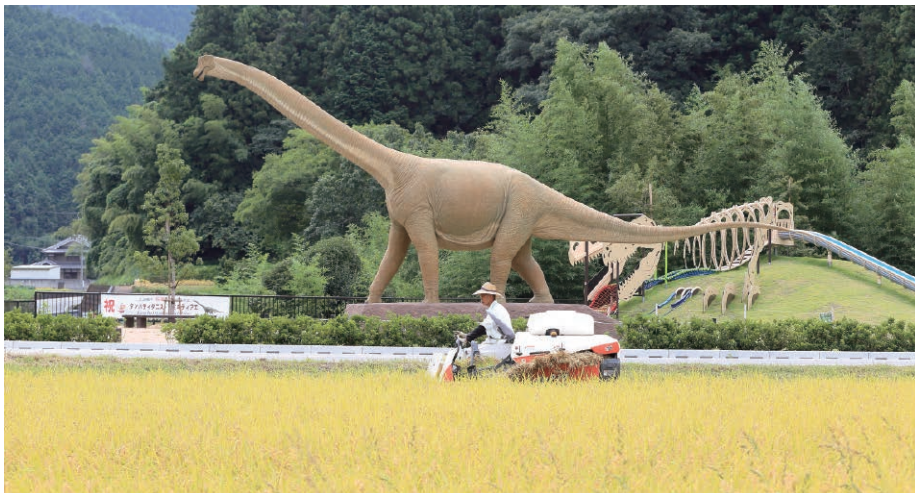
2006年に白亜紀の恐竜・ティタノサウルス形類の化石が発掘され、丹波竜として地域のシンボルになっている

国内で化石が発見された恐竜では5例目で、推定体長は12メートルと国内最大級です。その後の調査で頭骨やろっ骨、歯、世界でも珍しい脳畔など約2万点の化石が見つかっています。丹波市の丹波竜化石工房「ちーたんの館」では、丹波竜の実物大全身骨格が展示され、また、VR（バーチャル・リアリティー）により、丹波竜が生きた時代を体感することができます。丹波の歴史の壮さを感じさせるとともに、新たな観光資源として人気を集めています。