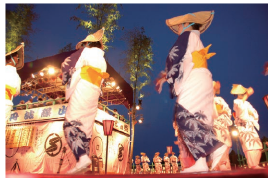
デカンショ祭り。日本遺産にも選ばれたデカンショ節に合わせたの総踊りは壮観だ

例えば、デカンショ節に「並木千本 咲いたよ咲いた 濠に古城の 影ゆれて」をはじめ歌詞の中で多く歌われる篠山城跡は、1609（慶長14）年に徳川家康が旧山陰街道沿いに築いた城で、2000（平成12）年に大書院が復元され、一般に公