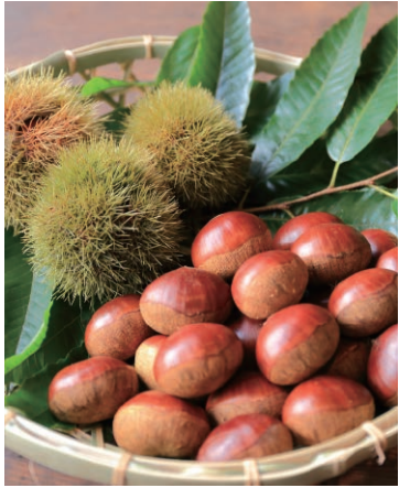
「丹波黒大豆」「丹波栗」「大納言小豆」「丹波山の芋」などは、丹波ブランドとして全国に知られている

兵庫県も、丹波の特産物をより多くの人に知ってもらい、味わってもらうため、農業の担い手育成や、消費の拡大、食品表示指導など「丹波ブランド」の振興に取り組んでいます。その結果、新規就農者も増えています。