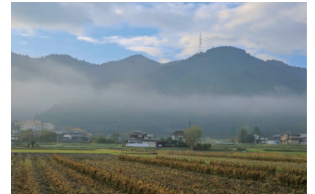
盆地状の地形が生み出す丹波霧は、幻想的な風景を演出するだけではなく、豊かな農作物も育む

山々が連なる間に盆地状の地形がつくられ、年間を通じて昼夜間の寒暖差が激しく、秋から冬にかけて発生する「丹波霧」は豊かな緑を幻想的に覆います。丹波地域には、このような気候風土と豊かな土壌に育まれた特産物が数多くあり、丹波ブランドとして全国に知れ渡っています。その代表格が「丹波黒大豆」。外観は球形で大粒、口当たりは滑らかで、もちもちと粘り気があり、甘みも強いのが特徴です。煮炊きしても皮が破れにくく、正月用の祝い豆として重宝されています。