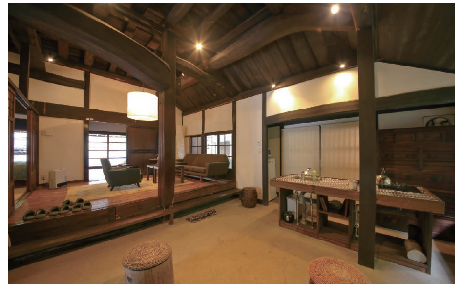
古民家を利用したカフェの経営など、丹波らしさに価値を求めて移住する人も増えつつある