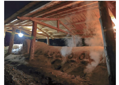
登り窯の高温焼成により生まれる独特の風合いは、丹波焼の芸術性を高めている

「嫁がほしゅうて 轆轤 ろくろ を蹴れば 土はくるくる 壺になる」は、日本六古窯の一つとして知られる丹波焼のことで、その発祥は平安時代末期までさかのぼり、登り窯と蹴りロクロ（左回転ロクロ）とともに、伝統技術を今に受け継いでいます。現在も約60軒の窯元が丹波焼を生産しています。2017年には、デカンショ節に続き、六古窯の他の産地とともに「きつと恋する六古窯 日本生まれ日本育ちのやきもの産地」が日本遺産に認定されました。