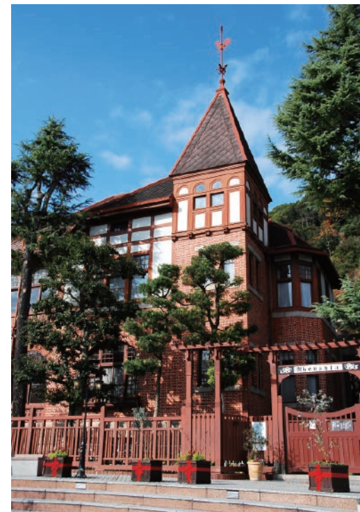
北野の異人館群は定番の観光スポット。なかでも風見鶏の館はよく知られている異人館のひとつです

2017年1月1日、神戸港は幕末の開港からちょうど150年を迎え、2018年7月12日には兵庫県が誕生してから150周年を迎えました。県庁発祥の地である兵庫津をはじめ、神戸のまちでは、今後の方向性を考えるきっかけとして数多くの記念イベントが開催されました。兵庫区の新開地商店街には落語や演芸が毎日楽しめる「神戸新開地・喜楽館」が誕生し、新しい文化・伝統芸能の拠点となっています。一方、港湾地区では新たにホテルが稼働するなど、港ならではの景観や立地を生かした整備が進んでいます。今後、ますます神戸のまちの可能性が広がっていきます。