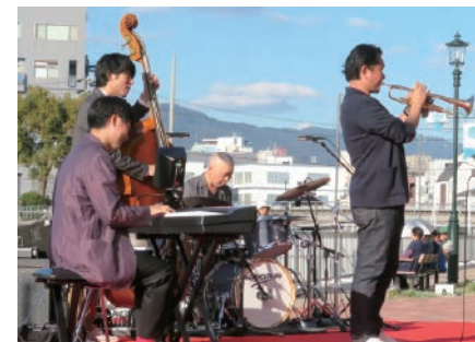
神戸が国内発祥とされるものは多い。ジャズもそのひとつで、今でも盛んに楽しんでいます