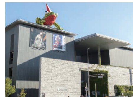
ユニークなデザインの兵庫県立美術館では、兵庫ゆかりの作家による作品が展示されています