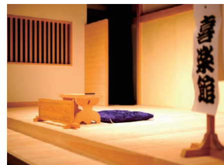
上方落語2つ目の定席として誕生した神戸新開地・喜楽館では、落語や演芸が毎日楽しむことができます