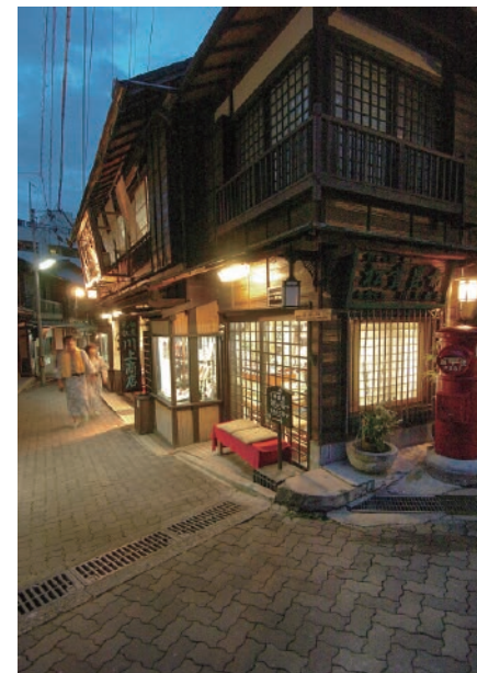
有馬温泉は全国的にも知られた名湯です。歴史を感じさせる街並みを散策するのも楽しい

欧米文化との融合で定着した洗練されたまちのイメージは1995年1月17日に発生した阪神・淡路大震災で大きく傷つくこととなります。とくに港湾の甚大な被害は、神戸港離れを引き起こし、現在は、大阪港と一体となって国際競争力を取り戻す取り組みが進められています。また、2006年