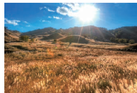
スキイの大草原が壮麗な砥峰高原。最近では映画やドラマのロケ地としても脚光を浴びています