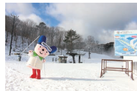
国内で14年ぶりの新設スキー場となった峰山高原リゾート。インバウンドを含めた誘客促進に期待がふくらみます