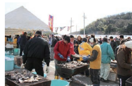
牡蠣養殖が盛んな西播磨の各漁港では、かきまつりイベントが行われ多くの人で賑わいます

また西播磨には世界に誇る研究施設があります。SPring-8は、播磨科学公園都市にある世界最高性能の放射光を生み出すことができる大型放射光施設です。放射光とは、電子を光とほぼ等しい速度まで加速し、磁石によって進行方向を曲げた時に発生する、細く強力な電磁波のことです。この放射光を用いてナノテクノロジー、バイオテクノロジーや産業利用まで幅広い研究が行われています。SPring-8を含む播磨科学公園都市には県立粒子線医療センター（たつの市）が陽子線と重粒子線の両方でがん治療が行える世界初の施設として開設され、国内屈指の治療実績を誇っています。また、兵庫県立大学理学部（上郡町）、兵庫県立大学附属中学校・高等学校（同）などの文教施設のほか工場用地もそろっており、知と研究、ものづくりが一体となったまちづくりが進められています。