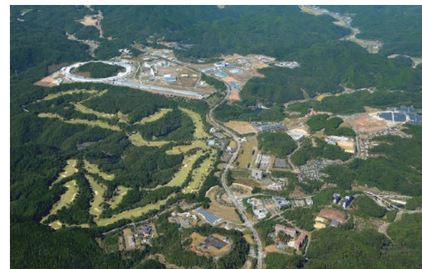
大型放射光施設SPring-8は世界最高性能の放射光を利用できる実験施設です