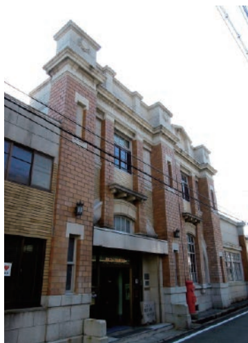
レトロないでたちのうすくち龍野醤油資料館。江戸時代から続くうすくち醤油づくりの歴史が紹介されています

手延素麺は約600年の伝統を誇り、明治27年には兵庫県手延素麺協同組合によって統一規格が設けられ、格付け等級として「揖保乃糸」という組合ブランドが誕生しました。戦後に入っても組合が厳しい品質管理を重視したことや、揖保乃糸資料館「そうめんの里」を通じた情報発信により消費者にブランド価値が高く評価されており、近年は米国をはじめ輸出も増えています。このほかにも千葉県、香川県とともに全国三大産地の一つに数えられている龍野の醤油、国内生産の約8割のシェアを占める姫路のマッチ、全国生産高の約7割を誇る姫路市の鎖製造業など多様な集積があります。