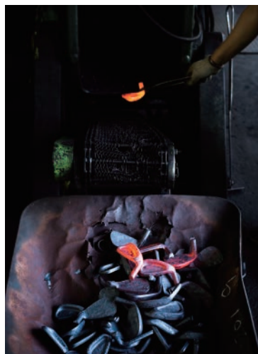
鍛造製法によって作られるアイアンヘッドは、世界のトッププロにも愛用されています

日本初のゴルフクラブ生産地も当エリアでした。日本製のクラブの製造が始まったのは昭和初期のことで、廣野ゴルフ倶楽部よりアイアンクラブのヘッドの研究依頼が三木市内の金物工業試験場に舞い込んだことをきっかけに当時の担当者が研究を始め、その後姫路で製造を始めたといわれています。現在も市川町を中心に業者が集積しています。