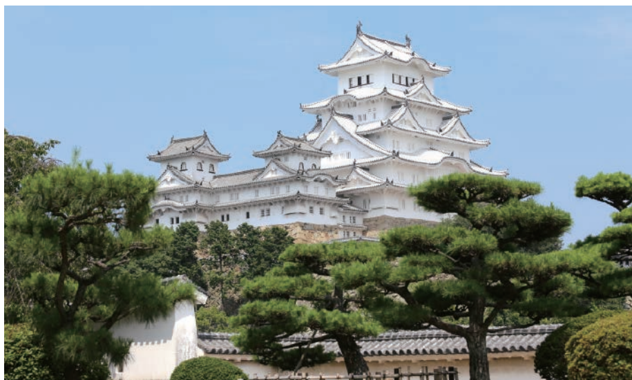
ユネスコ世界遺産にも登録された姫路城には、国内外から多くの人が訪れます