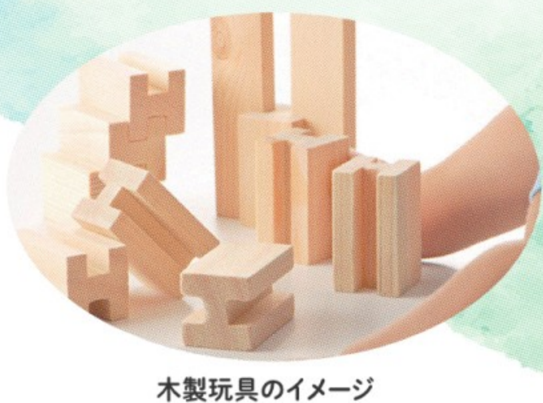
木製玩具のイメージ

「ひょうご 孫ギフト」で検索! / https://web.pref.hyogo.lg.jp/kf11/magogihuto.html