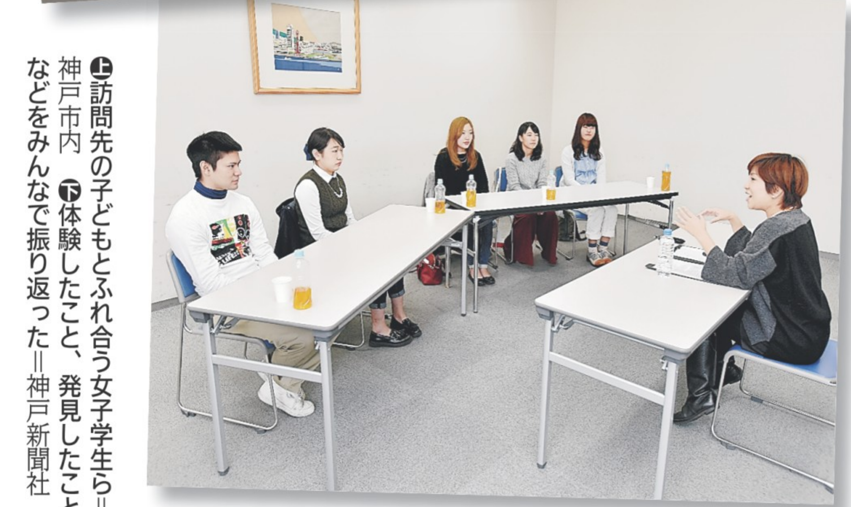
①訪問先の子ともとふれ合う女子学生ら②神戸市内③体験したこと、発見したことなどをみんなで振り返った④神戸新聞社