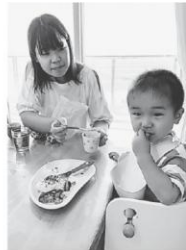
ごはんを食べてもらうのも 大仕事