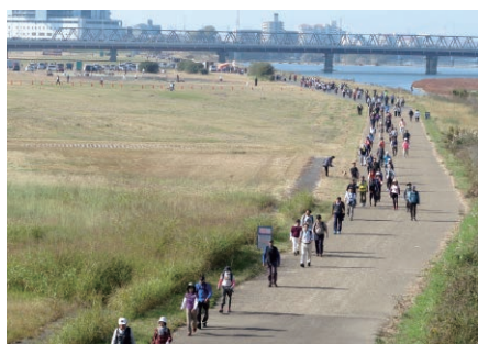
加古川河川敷にはマラソンコースが整備され、マラソンや駅伝のほか、ウォーキングイベントにも活用されている

兵庫県に河口を持つ河川の中では最長、最大の流域面積を誇る加古川はさまざまな恵みを地域にもたらしてきました。中世にはいくつかの舟運路が整えられ、闘竜灘（加東市）を中継地点とし上流から河口までの高瀬舟を用いた物流幹線の役割を担っていました。2003（平成15）年には「県立加古川河川敷マラソンコース（加古川みなもロード）」が整備され、毎年12月23日には加古川マラソンが開かれています。