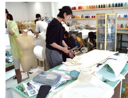
製品の開発・試作に挑む若手デザイナー

播州織の産地、西脇市には2017年春、若手デザイナーや織り職人のためのコワーキングスペース「 コ ン セ ン ト 」がオープンしました。マシンやデザイン用のコンピュータがそろい、先