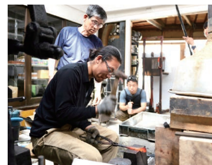
職人を目指す若者と指導する熟練職人

また、播州刃物の産地である小野市に、職人の後継者不足を解決し、育成するための工房が2018年7月に開設されました。運営に当たるのは地元 は のデザイン会社、シーラカンス食堂。現在、「実用性を突き詰めた中に表れる美」にほれ込んだ姫路市出身の20代男性が熟練職人の指導を受けながら製作活動