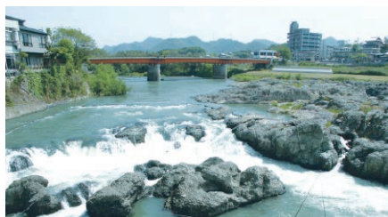
闘竜灘は加古川の中流に位置する名勝。起伏に富んだ奇岩が豪快な水の流れを生み出す