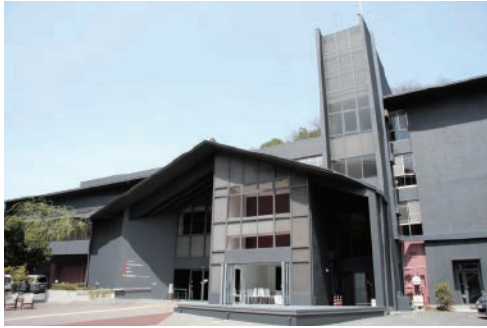
城崎国際アートセンターは、舞台芸術を中心に、アーティストが滞在しながら創造活動を行う拠点となっています

国際アートセンターがオープンしました。毎年国内外の選ばれたアーティストが滞在し、その創作過程を地域の方々に公開したり、市内小・中学校でのワークショップを実施するなどして、子どもたちが一流のアーティストと交流する機会を積極的に設けています。