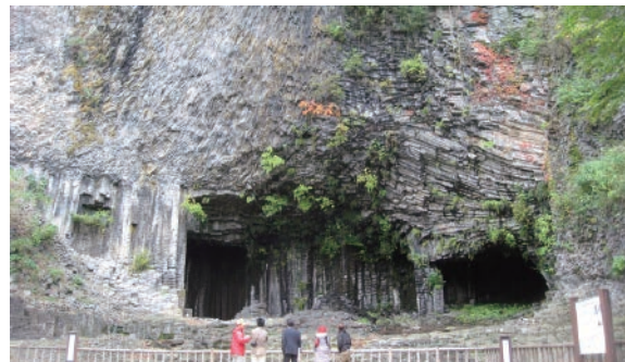
ユネスコ世界ジオパークに認定された山陰海岸。玄武洞では六角形と柱状の複雑な割れ目の玄武岩が、不思議な景観を生んでいます