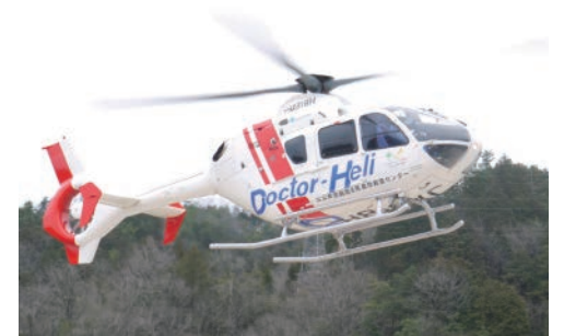
ドクターヘリは但馬救命救急センターとの連携で、緊急患者の救命率向上に大きく寄与しています

但馬地域では医師不足が心配されているところですが、公立豊岡病院の救命救急センターが中心となってドクターヘリを活用して救命率の向上につなげ、全国から注目を集めています。