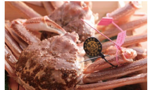
但馬の各漁港で水揚げされるズワイガニは松葉ガニと呼ばれ、冬を代表する味覚です

さらに、神戸ビーフの素牛である但馬牛、ズワイガニをはじめ食材豊かな土地でもあります。世界の舌を魅了する但馬牛の優れた血統を確立・堅持してきた飼養システムの重要性を後世に伝えるための取り組みも進んでいます。