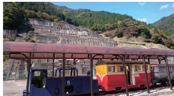
明延鉱山の選鉱施設として建設された神子畑選鉱場。産業遺産としての注目が高まっています

「山陰海岸ジオパーク」は2010年10月、地質や地形に表れる地球の歴史を学び、楽しむ地域を振興する世界ジオパークネットワークへの加盟（国内4カ所目）が認定されました。山陰海岸ジオパークは京丹後市の東端から鳥取市の西端までの東西約120kmの範囲に広がるエリアで、但馬地域では豊岡市・香美町・新温泉町が含まれます。