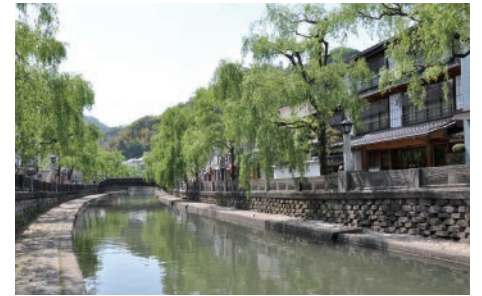
城崎温泉は文学作品の舞台にもなりました。大谿川沿いの風情溢れる景観を眺めながら7つの外湯が楽しめます

1300年の歴史を持ち、7つの外湯につながる大谿川沿いに風情のある温泉街を形成する「城崎温泉」、98度の高温かつ豊富な湯量を生かし、調理や洗濯など、古くから温泉を生活に利用してきた歴史を持つ「湯村温泉」、江戸時代には城下町として栄え、今なお当時の街並みが残されている出石周辺など自然と歴史が感じられる観光資源も多くあります。