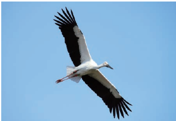
かつて絶滅の危機に瀕したコウノトリは試験放鳥された個体が自由に空を舞うところまで回復しました

コウノトリの野生復帰の取り組みが全国的にも注目を集めています。かつては日本全国各地に生息していたコウノトリ。1971年には日本でその姿が見られなくなってしまいました。最後の生息地であった豊岡でコウノトリ野生復帰の取り組みが始まり、人工飼育開始から25年目、ついにコウノトリのヒナが誕生。2005年に野生復帰に向けた試験放鳥がスタートし、