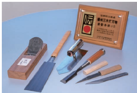
三木金物のうち、5品目が国の伝統的工芸品に指定されています

また、釣針は、全国生産の約8割を占めています。針先を円錐形に削る技術は播州針ならではの。国内最古の釣針メーカーである株式会社土肥富は月産1億本の釣針を製造し、世界130カ国に輸出しています。