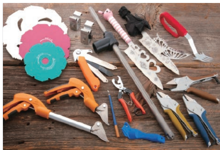
デザイン性に優れた金物製品も開発され、新たな市場の開拓が進んでいます