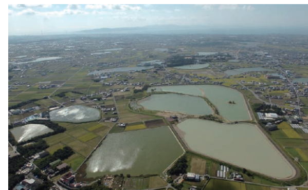
東播磨地域には多くのため池が造られてきました。水田への水の供給はもちろん、地域の文化にも影響を与えています

東播磨地域は日本有数のため池密度を誇り、県内最古の天満大池（675年築造）や甲子園球場の約12倍という県内最大の加古大池（満水面積49ha）、多様な生物が生息する池、伝説が残されている池など個性豊かな「ため池」が数多くあります。また、ため池とため池は水路網でつながれて一帯の水田へ水を供給し続けるとともに、文化を育み、独特の風景をつくってきました。これらのため池群を核とした地域づくりを目指して2007（平成19）年に「いなみ野ため池ミュージアム運営協議会」が設立されました。ため池の保全活動や観察活動を農業者だけでなく、地域住民の力を結集した活動が高く評価され、2013（平成25）年には日本水大賞農林水産大臣賞を受賞しました。