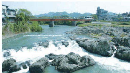
闘竜灘は加古川の中流に位置する名勝です。起伏に富んだ奇岩が豪快な水の流れを生み出しています