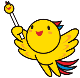
兵庫県マスコット はばたん