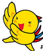
兵庫県マスコット はばたん

神戸クリスタルタワー3階 クリスタルホール (神戸市中央区東川崎町1-1-3) ●JR神戸駅より徒歩3分